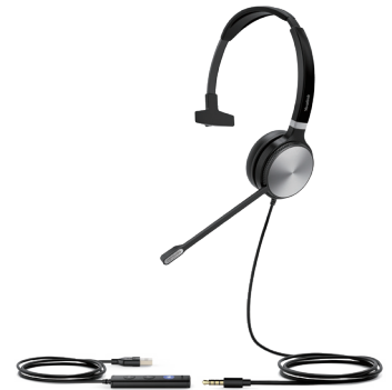
UH36 Mono Teams UH36 Mono UC

Umfassende Integration mit Yealink IP-Telefonen, mit direktem Zugriff auf erweiterte Funktionen wie Synchronisierung der Lautstärke und Steuerung mehrerer Anrufe.