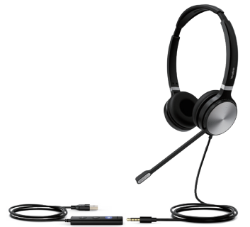
UH36 Dual Teams UH36 Dual UC